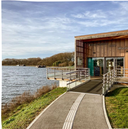
OFFICE DE TOURISME Esplanade des Itinérances Quai Lafayette 21170 SAINT-JEAN-DE-LOSNE Tél. +33 (0)3 80 37 15 70